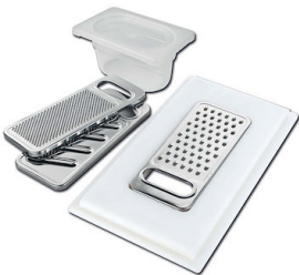
Kit râpes avec anneau de support et cuvette 8159 101 * uniquement en combinaison avec l'accessoire 8644 101