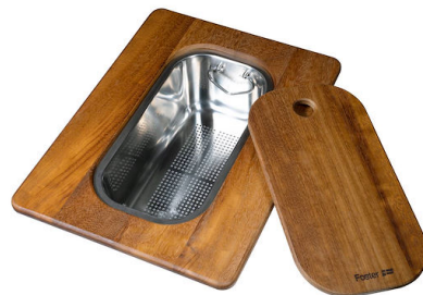
Planche de découpe Twin en bois Iroko avec tamis en acier inoxydable 8644 044