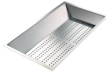
Cuvette perforée en acier inoxydable 8151 000 * uniquement en combinaison avec l'accessoire 8644 101